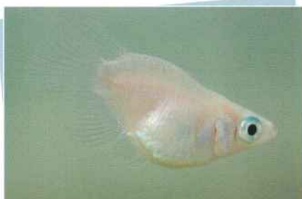
ピュアホワイトダルマ ¥2,500