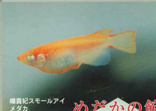
楊貴妃スモールアイ メダカ