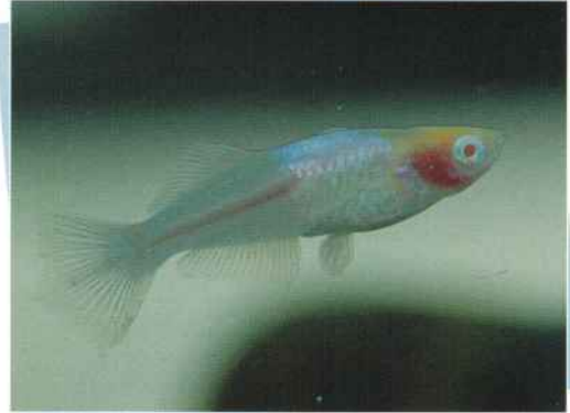
アルビノ透明鱗ホタル ¥10,000