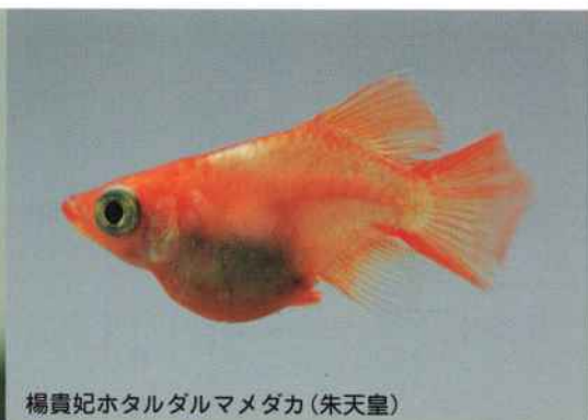
楊貴妃ホタルダルマメダカ(朱天皇)