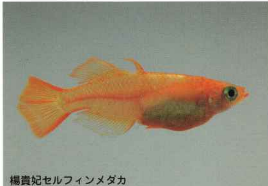
楊貴妃セルフィンメダカ

屋外のメダカにはそろそろ餌を止めます。 めだかの館では、屋外の水槽には底砂を多めに入れ、メダカの布団として枯葉を入れてやります。それと同時にハウス内では、シーズンオフを利用して、じっくりと新種メダカ作出に取り組んでいます。 ハウス内の温度20℃～30℃ 水温18℃～30℃