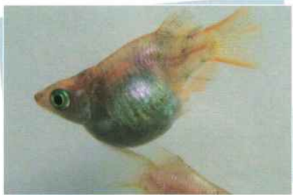
白斑ホタルダルマ ¥3,000