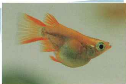
琥珀ダルマ(琥珀丸) ¥4,000