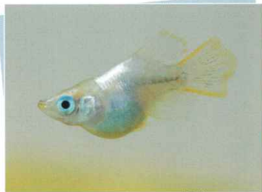
シルバーホタルダルマ(煌) キラメキ ¥5,000～