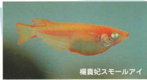
楊貴妃スモールアイ