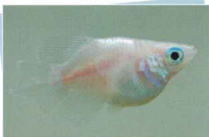
ピュアホワイトホタルダルマ(白鷺) ¥4,000