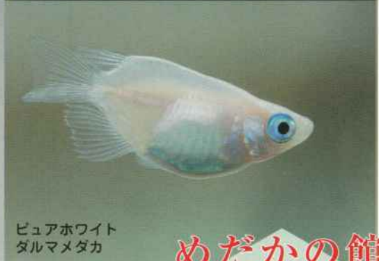
ピュアホワイト ダルマメダカ