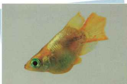
黄金ホタルダルマ(金皇丸) ¥10,000