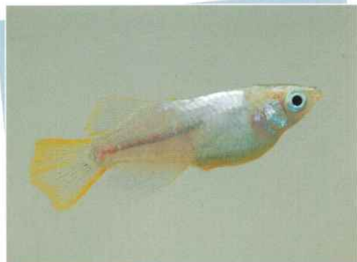
シルバーホタル(銀河) ¥3,000