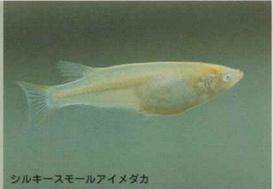
シルキースモールアイメダカ