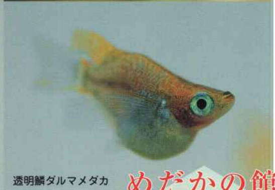
透明鱗ダルマメダカ