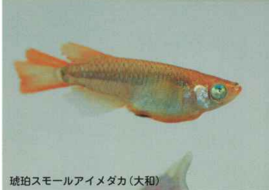
琥珀スモールアイメダカ(大和)