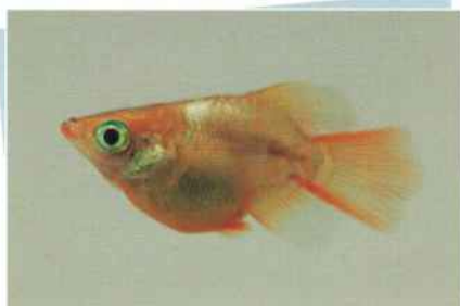
琥珀ホタルダルマ(琴琥) ¥7,000~