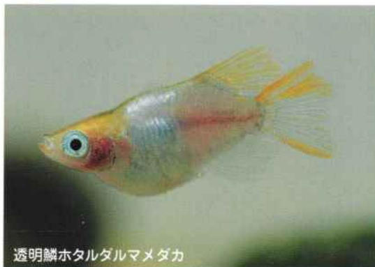
透明鱗ホタルダルマメダカ

気温も落ち着き過ぎやすい時期になりました。メダカはまだ産卵しますが、冬までに大きくなれないメダカは、冬場に死んでしまいますので、室内飼育に切り替えることができない場合は卵を採らない方がいいかもしれません。