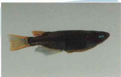
ピュアブラック黄金(利休) ¥5,000~¥10,000

2002年当店にて作出いたしました。ピュアブラックのヒレに黄金色が入り大変美しいメダカです。