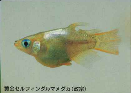
黄金セルフィンダルマメダカ(政宗)