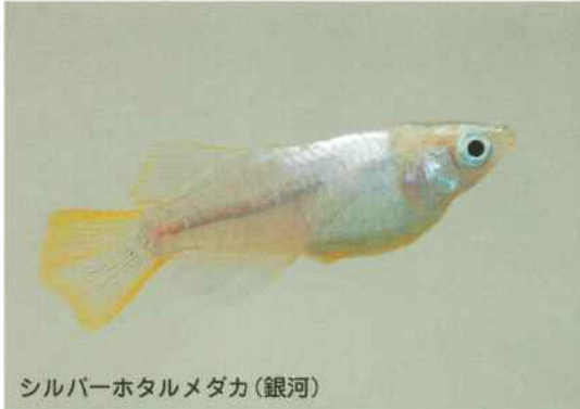
シルバーホタルメダカ(銀河)

冬場、屋外飼育のメダカは活動がにぶるため、えさやりや水かえなどの世話をする必要はありません。めだかの館では冬場も繁殖をさせているため、繁殖ハウス内は20℃～30℃夏場の気温です。 親メダカ全水槽産卵中。1対1の交配を繰り返し、10月に産まれたF1メダカを選別し、F2で交配を繰り返します。