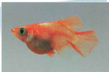
楊貴妃ホタルダルマ(朱天皇) ¥10,000~