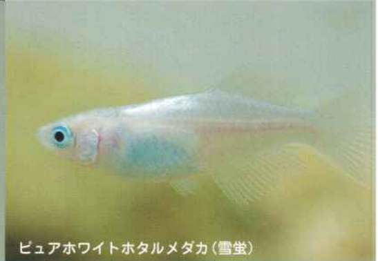
ピュアホワイトホタルメダカ(雪堂)