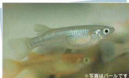
青メダカ(パール)(パープル) ※写真はパールです