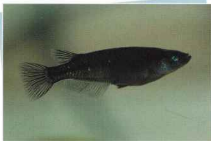
ピュアブラック(黒べえ) ¥5,000~¥20,000