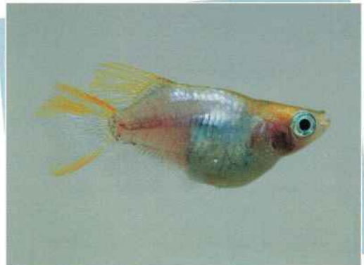
透明鱗ホタルダルマ ¥4,000