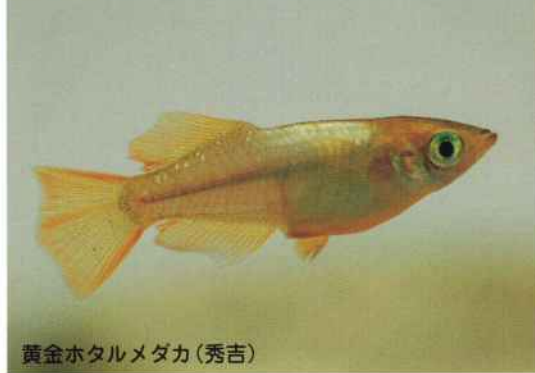
黄金ホタルメダカ(秀吉)