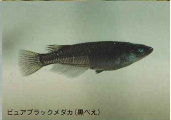
ピュアブラックメダカ(黒べえ)