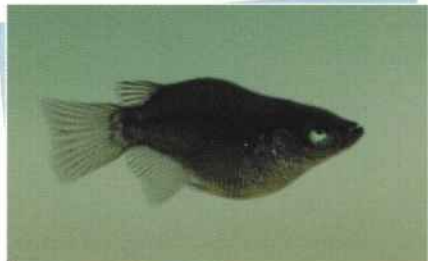
ピュアブラックダルマ(小錦) ¥10,000~¥200,000