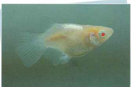
アルビノホタルダルマ ¥10,000