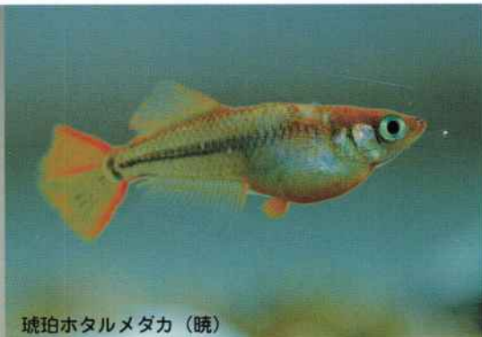
琥珀ホタルメダカ (暁)