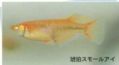
琥珀スモールアイ