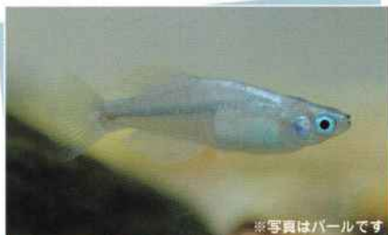
青ホタル (パール) (パープル)