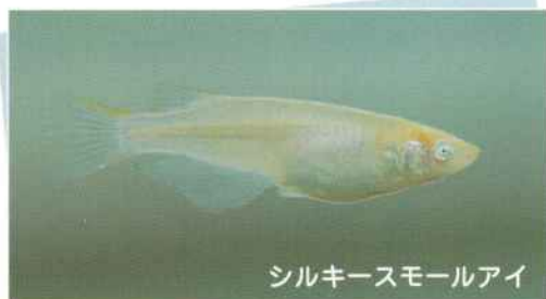
シルキースモールアイ

2001年に当店にて作出。現在も、いろいろなメダカに遺伝させております。1匹のスモールアイ発見より6年、当店にて数々のスモールアイを作出してきました。目が小さく点でカッコイ系のメダカです。ピュアブラックの子孫達になります。保護色の機能が鈍いため、いろいろな色が存在しております。新色多数で、今、マニアの中で人気上昇中のメダカです。