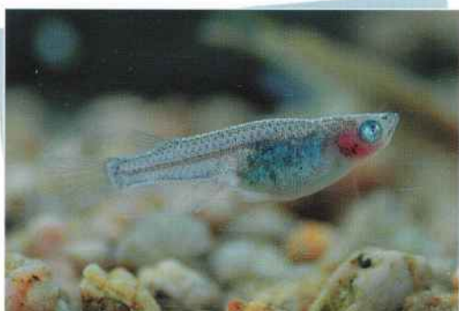
青透明鱗スモールアイ