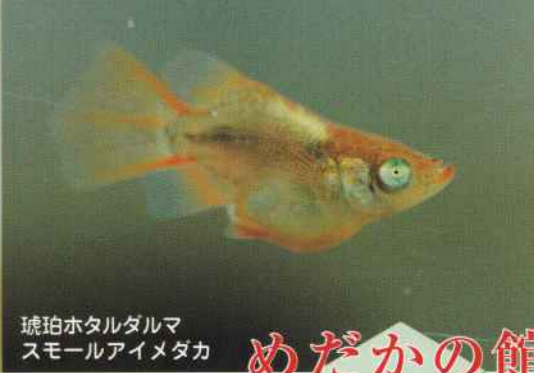
琥珀ホタルダルマ スモールアイメダカ