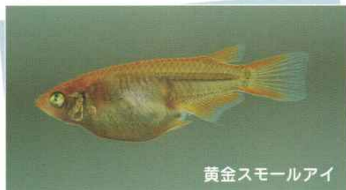
黄金スモールアイ