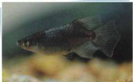
ピュアブラックホタルダルマ(弁慶) ¥30,000~¥200,000