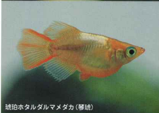
琥珀ホタルダルマメダカ(琴琥)