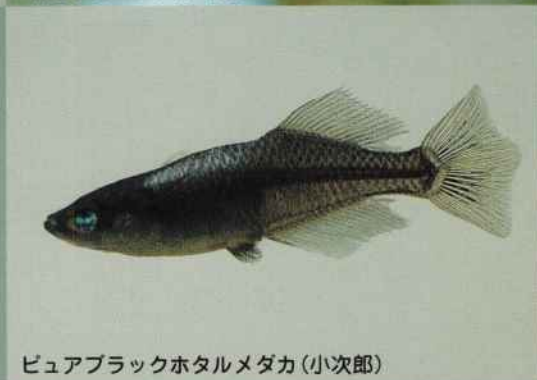
ピュアブラックホタルメダカ (小次郎)