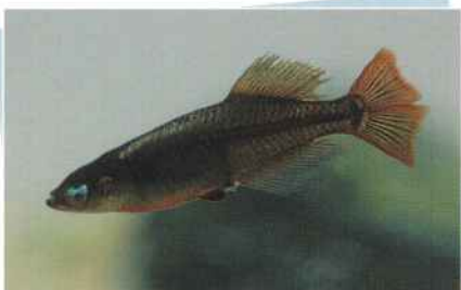
ピュアブラック黄金ホタル(武蔵) ¥20,000~¥50,000