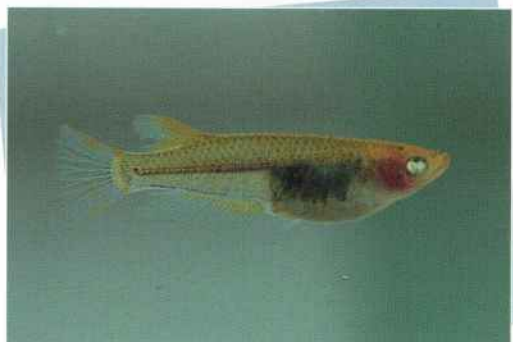
黄金透明鱗スモールアイ

透明鱗とスモールアイの交配により、2006年作出したメダカ達です。また、このメダカ達の交配により、新種メダカが産まれてくると思われます。