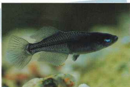
ピュアブラックホタル(小次郎) ¥10,000~¥30,000