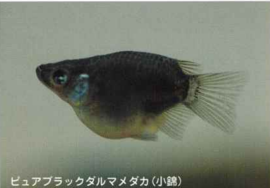
ピュアブラックダルマメダカ(小錦)