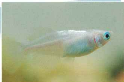
ピュアホワイトホタル(雪蛍) ¥2,000