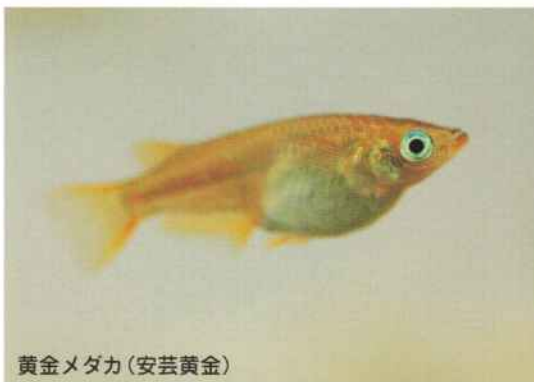
黄金メダカ(安芸黄金)

3月に入るとわりと暖かい日もできます。しかし、暖かくなったり寒くなったりと気温の変化のある時期だと思います。 室内のメダカを屋外に出すのは、安全を考えて避けたほうがいいかもしれません。 屋外のメダカには、3月下旬位から徐々に餌を与えます。 ハウス内の温度に要注意。水温も35℃を越す事があります。日除け対策が必要です。