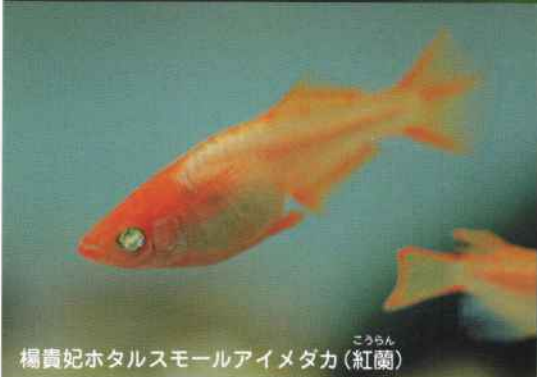
楊貴妃ホタルスモールアイメダカ(紅蘭)