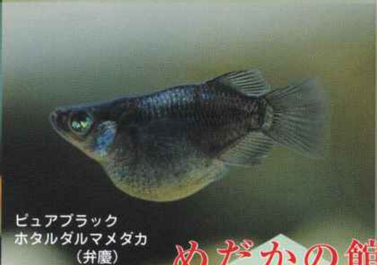
ピュアブラック ホタルダルマメダカ (弁慶)