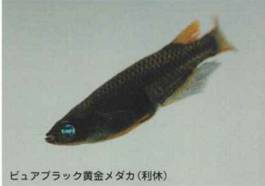
ピュアブラック黄金メダカ(利休)