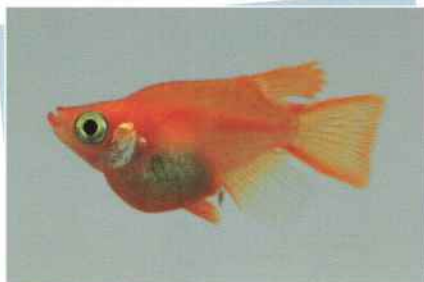
楊貴妃ダルマ(初恋) ¥8,000