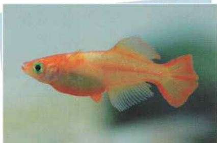
楊貴妃ホタル(東天光) ¥5,000