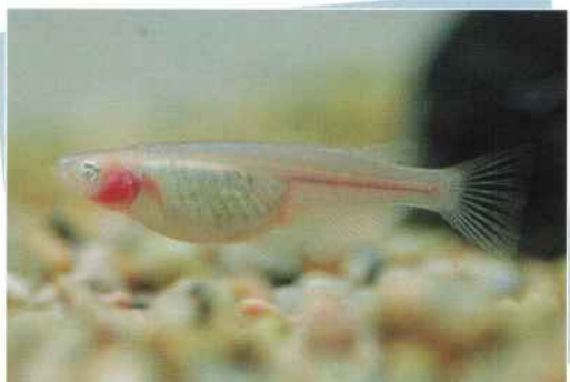
シルキー透明鱗スモールアイ