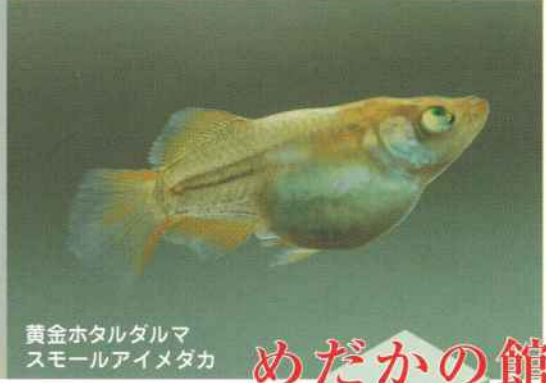
黄金ホタルダルマ スモールアイメダカ