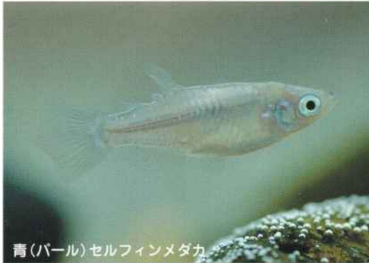
青(パール)セルフインメダカ

メダカが産卵をはじめの時期です。めだかの館では、主にシュロの皮に卵をうみつさせせています。 水温が17℃前後の時期は、メダカが病気になりやすいので注意が必要です。メダカの様子がおかしくないか、よく観察してください。