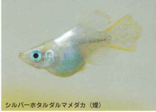
シルバーホタルダルマメダカ(煌)