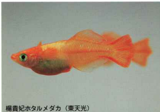
楊貴妃ホタルメダカ (東天光)

夏場はメダカも活発に活動しますので、餌は1日2~3回与えてください。又、水の悪化も早くなりますので、注意が必要です。定期的な水換えをおこなってください。