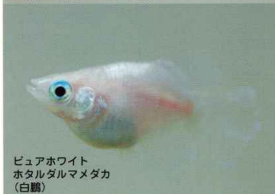
ピュアホワイト ホタルダルマメダカ (白鷗)