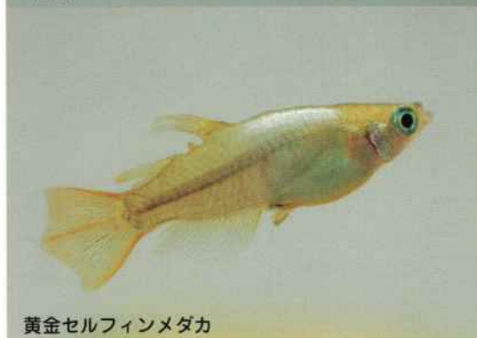
黄金セルフインメダカ