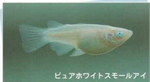
ピュアホワイトスモールアイ