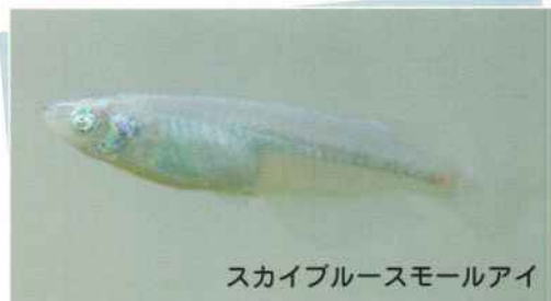
スカイブルースモールアイ