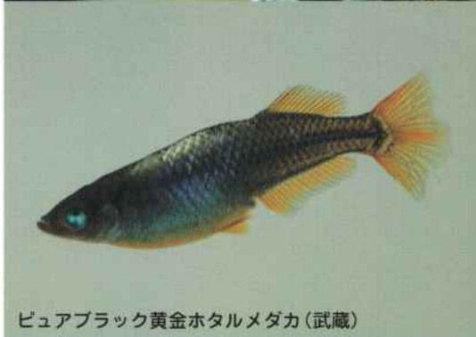
ピュアブラック黄金ホタルメダカ(武蔵)