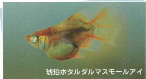
琥珀ホタルダマスモールアイ