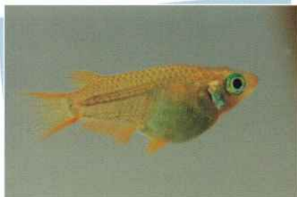
黄金ダルマ(金鱗丸) ¥3,000~