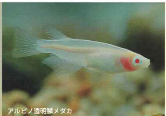
アルビノ透明鱗メダカ