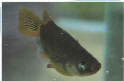
ピュアブラック黄金ダルマ(武蔵丸) ¥30,000~¥150,000