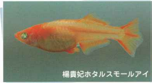
楊貴妃ホタルスモールアイ