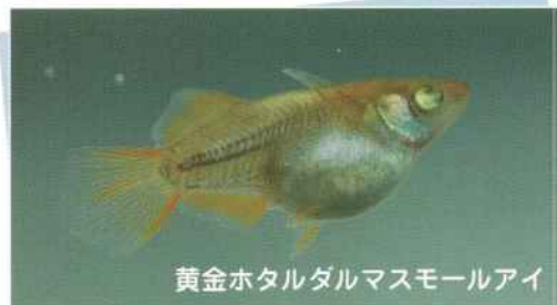
黄金ホタルダマスモールアイ