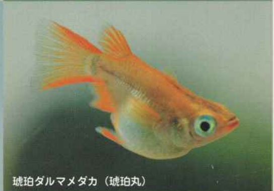
琥珀ダルマメダカ(琥珀丸)