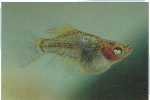
黄金透明鱗スモールアイホタルダルマ