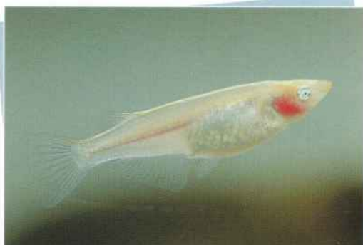
シルキー透明鱗スモールアイ