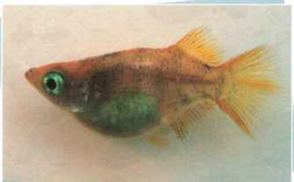
黄斑ホタルダルマ ¥3,000