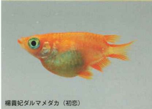
楊貴妃ダルマメダカ(初恋)