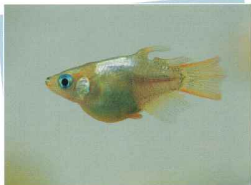
黄金セルフィンダルマ(政宗) ¥10,000

※ 体型はホタル、ホタルダルマ。 体色は黄、黄金、シルバー、パール、 パープル、透明鱗、楊貴妃、琥珀 その他、各種あります。